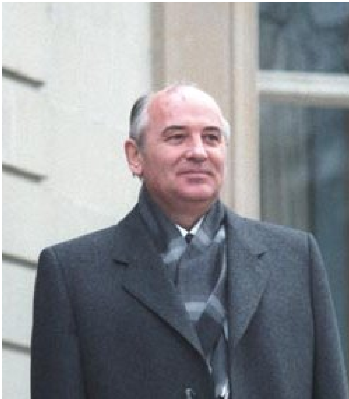
Михаил Сергеевич Горбачев