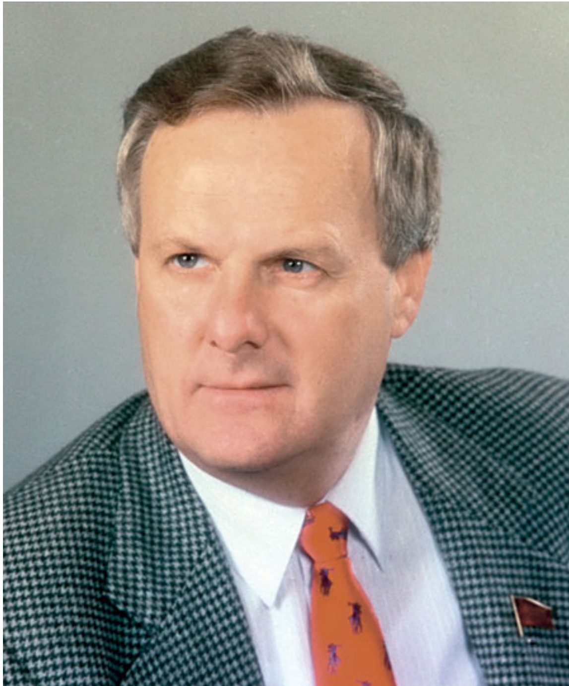
Анатолий Собчак первый мэр города