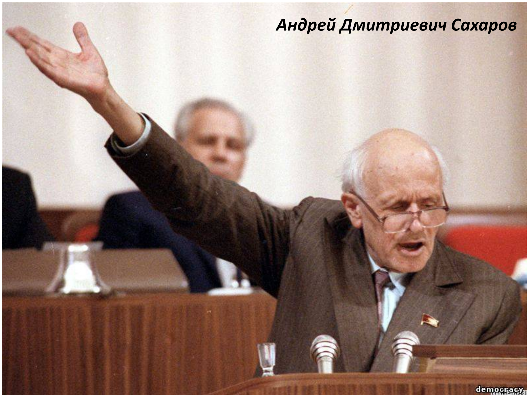
Андрей Дмитриевич Сахаров